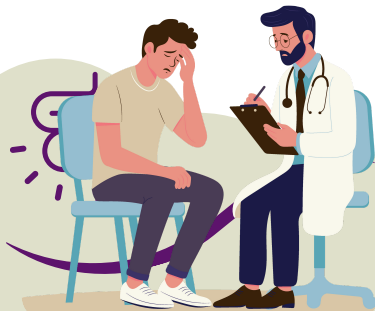
Jornada do Paciente

Entre os sintomas da doença de Crohn, destacam-se a dor abdominal, a diarreia persistente, a fadiga, a perda de peso e a anemia. Alguns pacientes também apresentam manifestações extraintestinais (3) .